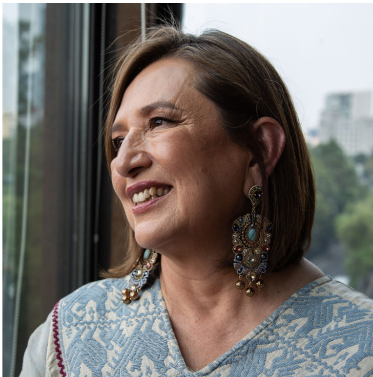
Xóchitl Gálvez.